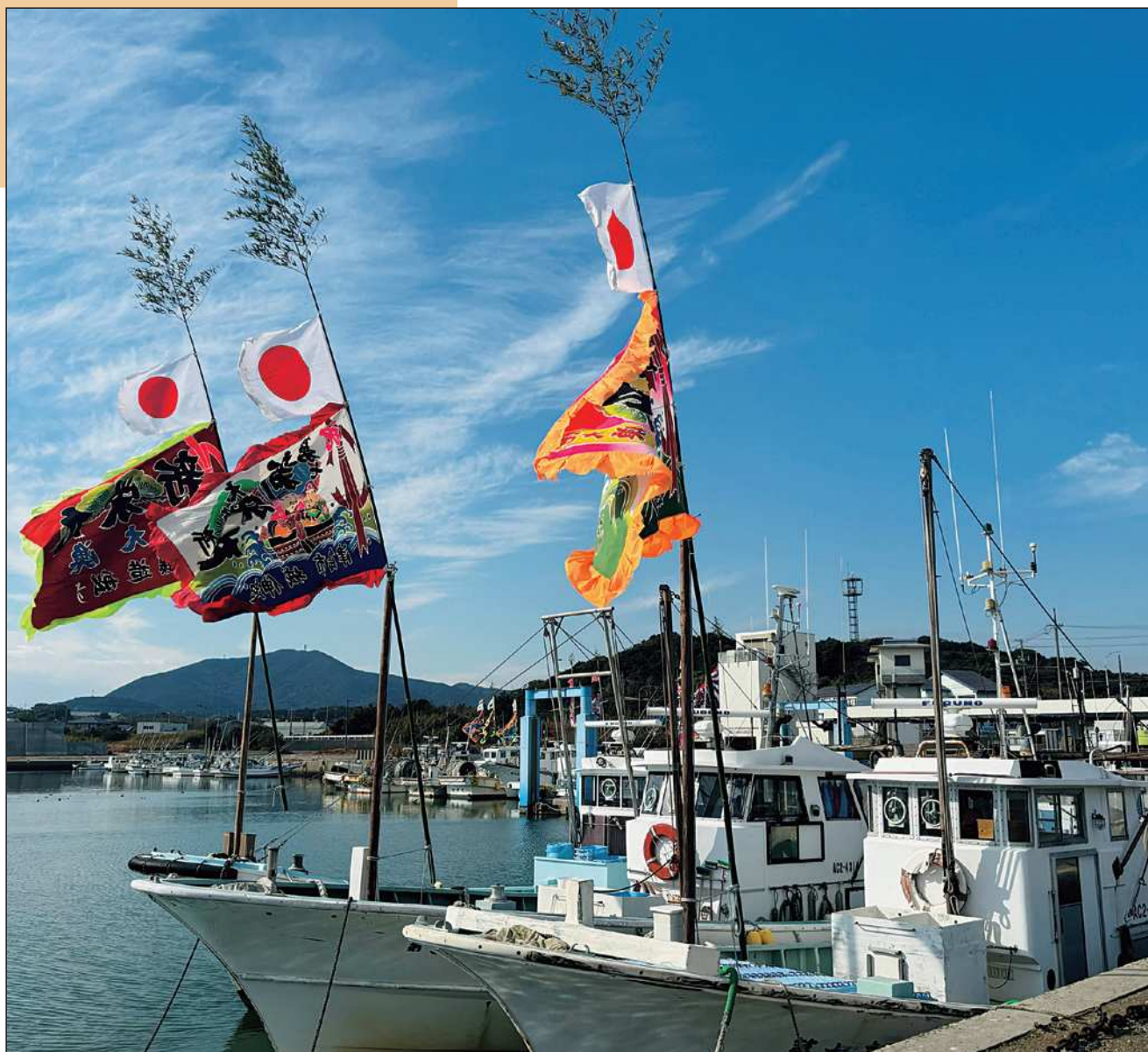
正月の赤羽根漁港(田原市)