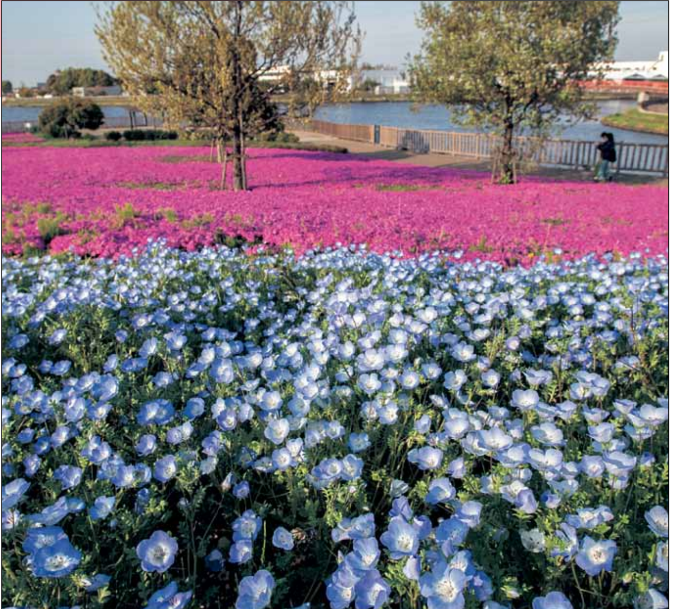
三ツ又池公園 芝桜とネモフィラ(弥富市)