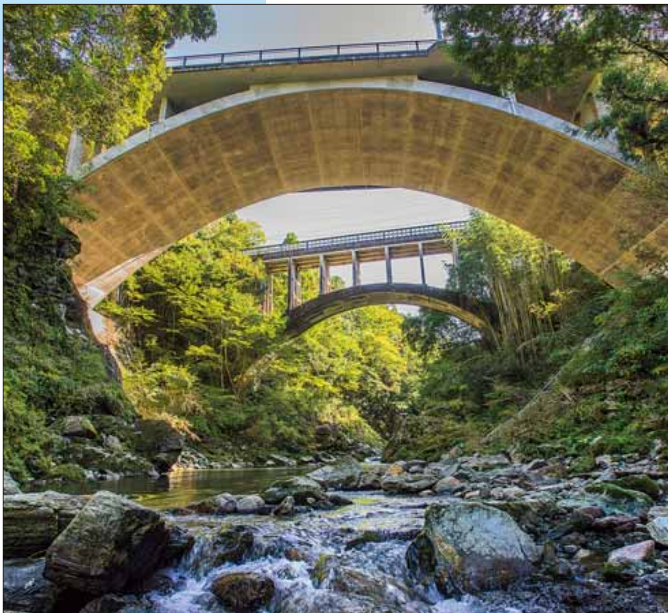
旧黄柳橋(きゅうつげばし)(愛知県新城市)