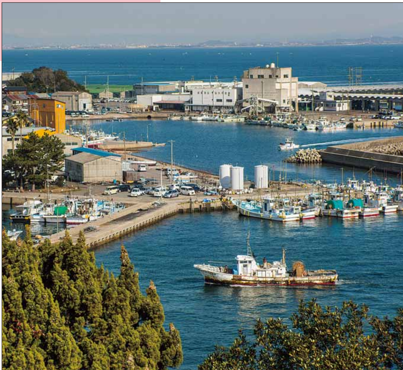
師崎港(愛知県知多郡)