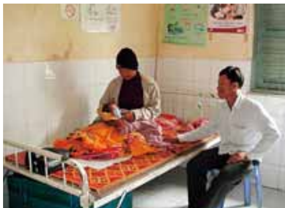
出産直後の家族—カンボジア農村部の公立診療所にて