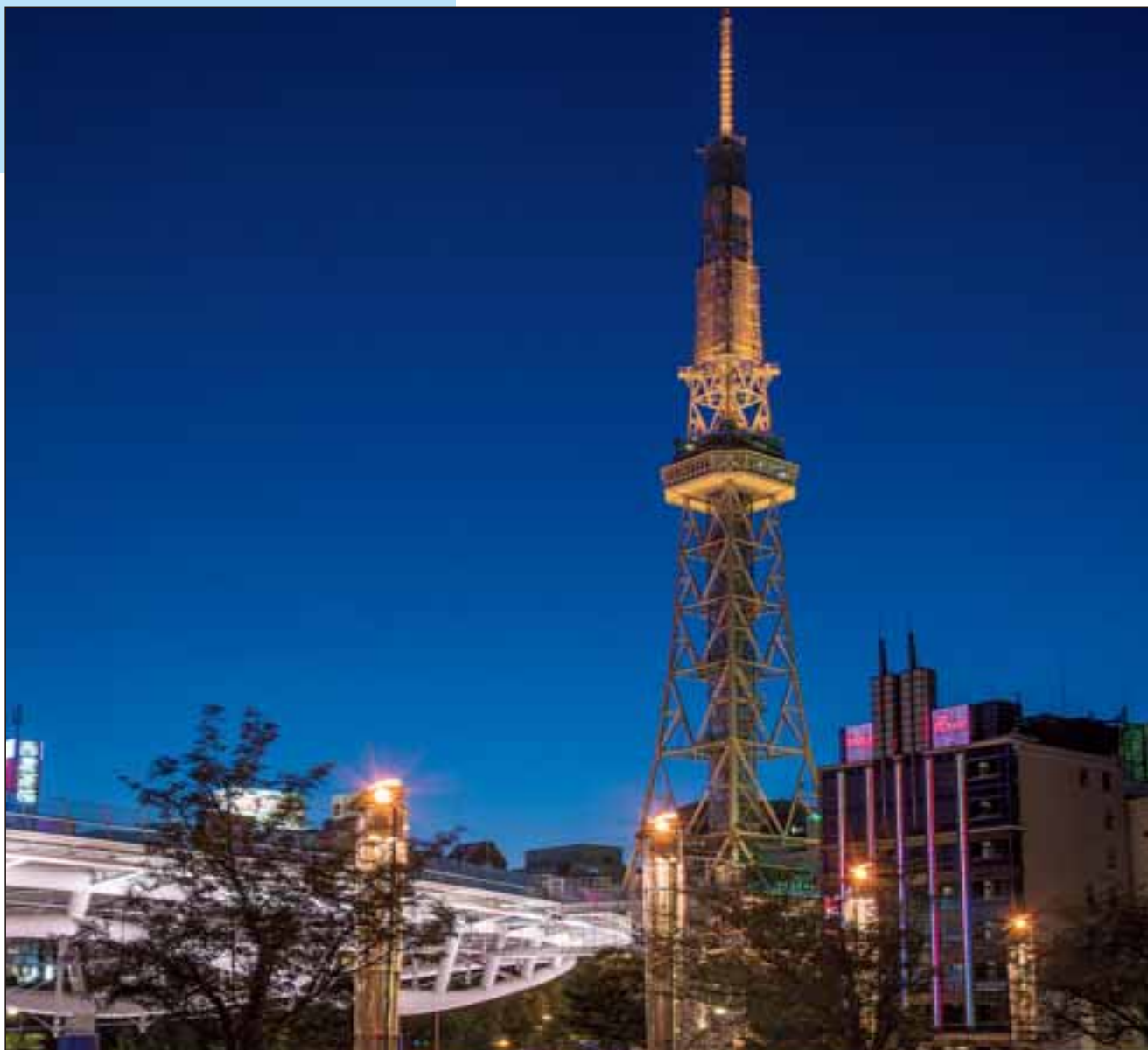
名古屋テレビ塔(名古屋市)